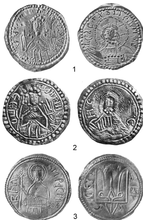
Рис. 1. Златник (1) и сребреники типа 1 (2) и 2 (3) Владимира Святого (по: [Сотникова, Спасский, с. 60, 64, 69])

Надпись на одних златниках и сребрениках I типа утверждала единовластие Владимира вследствие принадлежности ему киевского стола: «Владимиръ на столѣ»; на аверсе других – принадлежность князю императорской и королевской регалии чекана монет: «Владимиръ, а се его злато (сребро)». Эти тексты варьировались в полноте, но содержание оставалось прежним [Гайдуков, Калинин, с. 415].